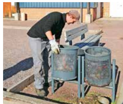
Les corbeilles de déchets gérées par Handyjob