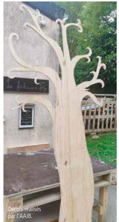
Décors réalisés par l'AAJB.