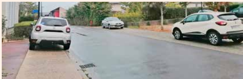
Pourtant, il y a une place de parking libre en face...

Alors oui, nous avons fait le choix d'axer notre action sur la préservation de l'environnement. Non, nous n'avons pas un budget extensible à volonté et oui, nous sommes dépendants de la communauté urbaine pour l'entretien de la voirie ; et oui encore, nous nous refusons à mettre un gendarme derrière chaque habitant.