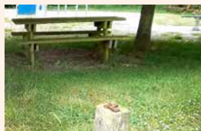
Un chien équilibriste !

Est-il si difficile de ne pas se stationner sur les trottoirs, de ramasser ses déchets ou les crottes de son chien, d'enlever de temps à autre les mauvaises herbes devant son habitation ? De rentrer ses poubelles après le passage du service des ordures ménagères, de ralentir sa vitesse dans les rues de Louvigny ou de ne pas prendre le planitre et le bord de l'Orne comme une salle de concert à ciel ouvert pendant une partie des nuits d'été ? Vivre ensemble implique des obligations qui ne se délèguent pas. Le Maire assume bien évidemment ses responsabilités d' élu local au premier rang desquels figurent la sécurité, le bon