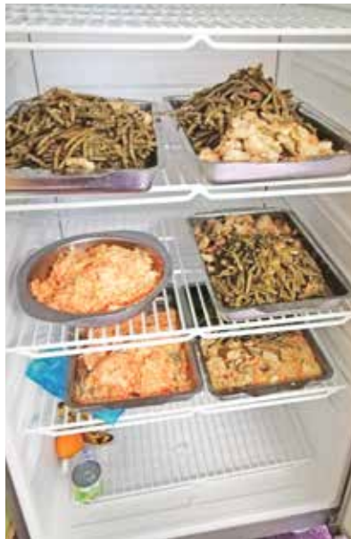
Les restes de repas non servis.

Pour mesurer l'ampleur de ce gaspillage, élus et agents de cantine, épaulés par Sybille Jardin, étudiante en développement durable et animatrice du projet Défi assiettes vides, ont procédé à la pesée des différents composants du repas pendant une semaine. Le poids de la nourriture livrée et le poids de la