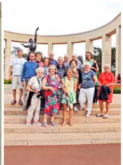
Le groupe franco-italien au cimetière américain de Saint-Laurent-sur-Mer.