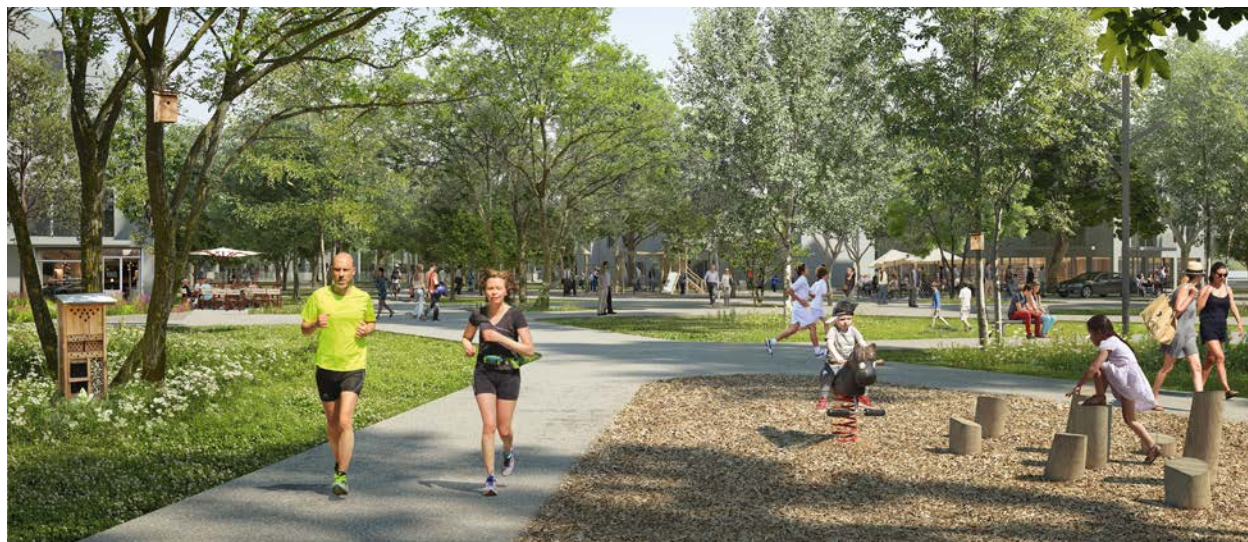
Aménagement de l'entrée de ville

En octobre 2019, nous évoquions déjà ( Loupy n°69 pour les « LOUPYnophiles ») l'intérêt de recourir à une procédure de « Zone d'Aménagement Concerté » (ZAC) pour nous permettre de passer du Plan Local d'Urbanisme (PLU) approuvé en décembre 2016 à la réalisation des nouveaux quartiers.