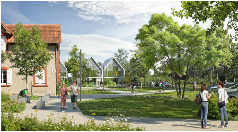
Aménagement du Hameau du Mesnil.

rise le patrimoine historique et offre un accès privilégié à la trame verte menant au cœur de la ville.