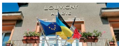
Merci au magasin Botanic d'avoir gracieusement offert les plantes qui agrémentent le balcon de la mairie.

Prochains conseils municipaux : lundi 22 septembre, lundi 17 novembre, lundi 15 décembre à 19 h à la mairie.