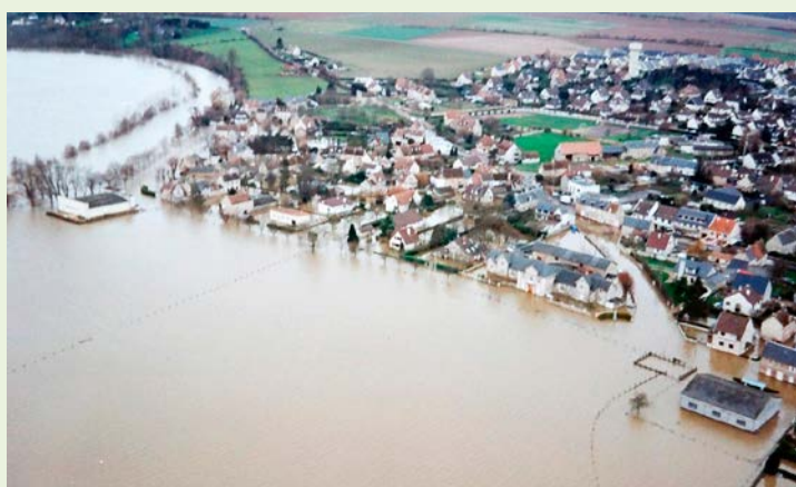
Louvigny inondée en janvier 1995.

I l y a 100 ans, Louvigny était touchée par des inondations très importantes qui deviendront la référence de crue centennale sur laquelle tous les modèles et plans de secours d'aujourd'hui s'appuient pour définir le rôle de chacun en cas de débordement des cours d'eau, l'Orne et l'Odon. Si vous avez des témoignages, des photos, des coupures de presse des événements qui ont marqué ces cent dernières années, n'hésitez pas à les prêter à la mairie de Louvigny qui organise une exposition dans ses locaux du 1 er octobre au 31 décembre 2025. Ils vous seront bien sûr restitués à l'issue de cette période. Un temps particulier sera organisé pour marquer la 4 e édition de la journée de la résilience qui aura lieu cette année le lundi 13 octobre 2025.