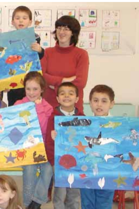
Exposition de dessins sur le thème de l'eau, au Musée des Beaux-Arts de Caen.

rateur d'eau de pluie a été installé au printemps dans la cour de l'école en vue d'arroser les plantes, les fruits et légumes du futur potager de l'école. Toujours grâce à eux et suite à un audit lancé par la mairie sur les économies d'eau et d'énergie réalisables sur l'ensemble des bâtiments publics de la commune, les installations en eau de l'école seront améliorées d'ici la fin de l'année scolaire.