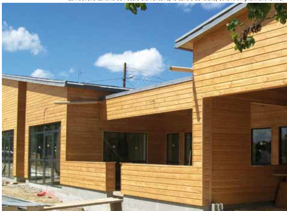
La nouvelle cantine de l'école élémentaire, le centre de loisirs, et le RAM prennent forme.

Le projet de budget a été élaboré dans ce contexte difficile. S'élevant à 1 782 000€, le budget de fonctionnement est en hausse de 82 000€, aug-