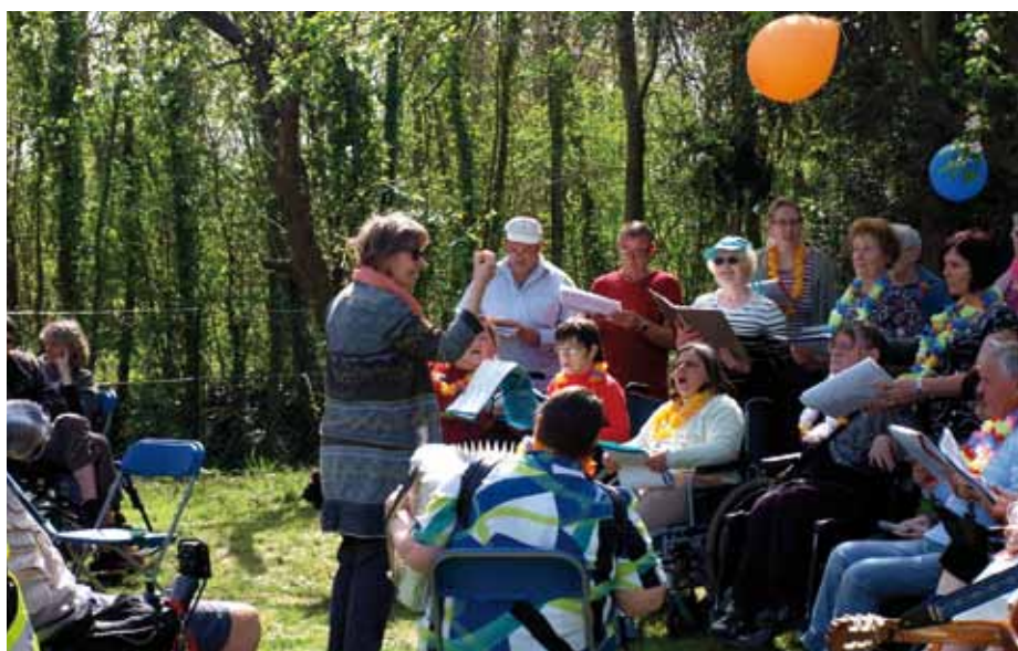
La chorale, Chantons ensemble, dans le Jardin extraordinaire de l'association Advocacy.

L'association fête les 10 ans de son Espace Convivial Citoyen situé 5 rue Singer à Caen. Dans ce lieu, elle agit en faveur de personnes en souffrance psychique, met en place des actions favorisant le lien social, la citoyenneté et l'expression de compétences de chacun. C'est ainsi qu'en 2005 a été signée avec la commune de Louvigny une convention de mise à disposition d'un terrain près du rond-point du centre commercial. Depuis, les membres ont métamorphosé cette friche en « Jardin extraordinaire » et la convention vient d'être renouvelée. N'hésitez pas à venir à la rencontre des heureux jardiniers d'Advocacy.