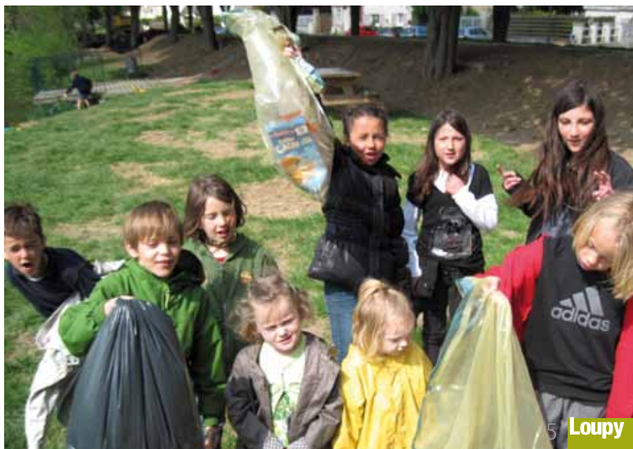
Nettoyage des berges de l'Orne par les enfants inscrits au centre de Loisirs.

Ne confonds pas l'aurore Et l'or qui brille comme le cor. Flotter dans un bateau Est le plus beau des cadeaux !