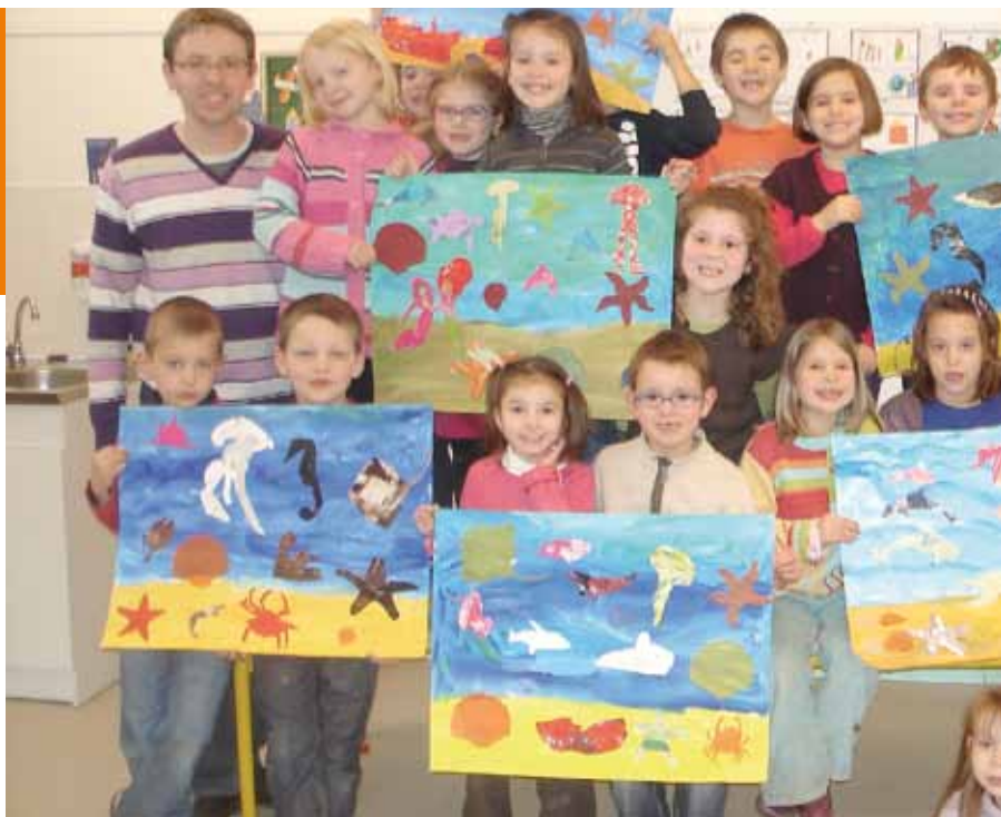
La classe de CP a participé à un atelier arts

Sur la base d'un diagnostic, un plan d'action a été élaboré au sein de chaque classe. Il a suscité des questions relatives à la consommation de l'eau