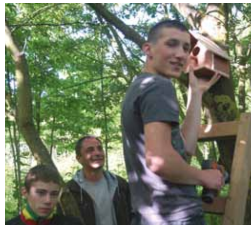
Pose des nichoirs créés par les jeunes de l'Association B. de Guitaut dans le Bois du Long Cours.

partage et d'émotion avec la Chorale « Chantons ensemble », réunissant dans le plaisir de chanter personnes valides et non valides.