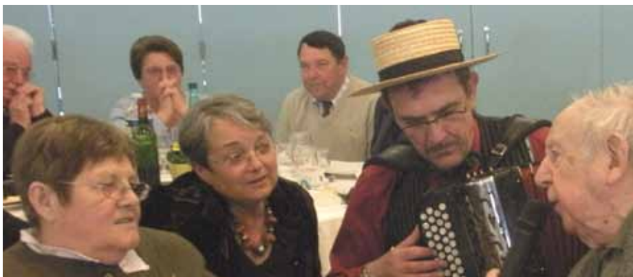
Le repas des anciens, un moment de convivialité.

Soucieux de la gestion du budget, désireux de maintenir le colis de fin d'année et le repas annuel instaurés depuis de nombreuses années, le conseil municipal et les membres du C.C.A.S. ont décidé de repousser l'âge pour l'invitation au repas, comme nous l'avons fait pour le colis il y a plusieurs années. Cela ne se fera pas en une seule fois : nous reculerons l'âge d'accès d'un an tous les 2 ans. Ainsi seront invitées au repas en 2012, les personnes nées en 1946 ; en 2014, y seront associées celles nées en 1947 ; en 2016, celles