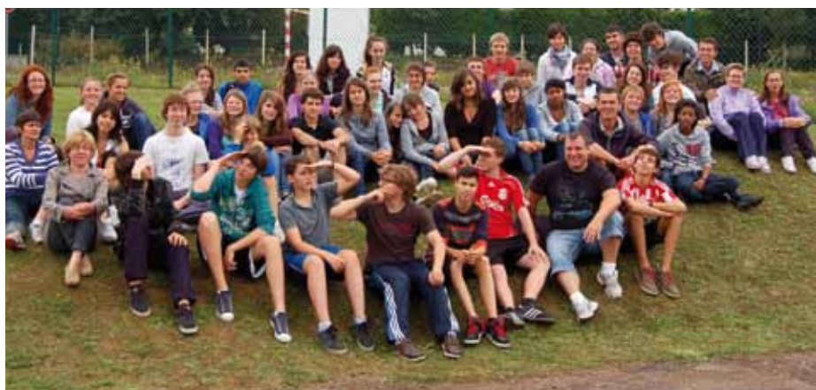
La cinquantaine de jeunes allemands, anglais, italiens et roumains auprès de leurs hôtes.

Quelques moments inoubliables : les spécialités culinaires de chacun des