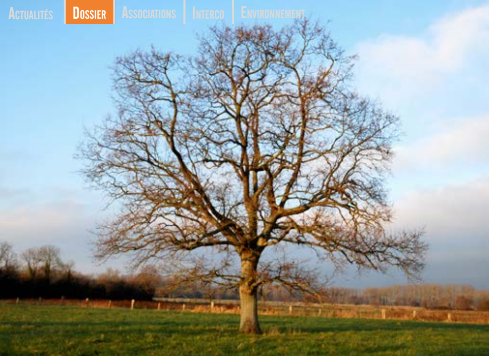
Chêne isolé en milieu de prairie.