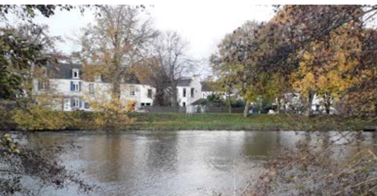
Le Planitre vu de l'autre rive.