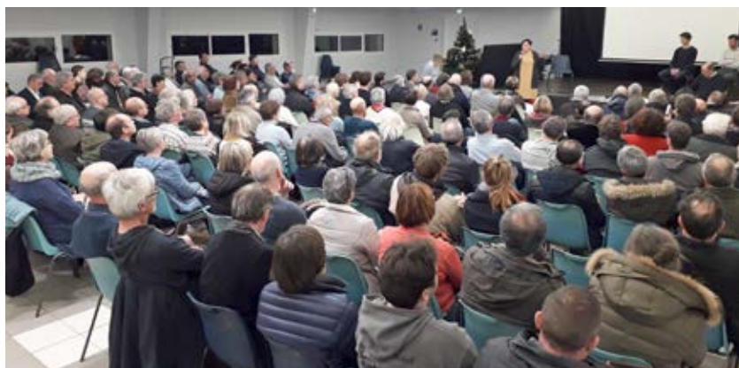
Forte participation à la réunion du 16 janvier, salle des fêtes de Louvigny.

Un an après sa première réunion publique L'Association Contre l'Allongement de la Piste de l'Aéroport de Caen-Carpiquet (ACAPACC) compte plus d'une centaine d'adhérents. Elle a déjà réuni plus de 1200 signataires de la pétition, participé aux manifestations pour le climat et adressé un courrier aux élus municipaux de Caen la mer. La réunion publique du 16 janvier a réuni plus de 150 participants qui ont échangé sur les enjeux climatiques du développement du trafic aérien. Ce ne sont pas seulement des riverains de l'aéroport subissant ses nuisances qui se mobilisent mais des citoyens du monde inquiets de l'aggravation des dérèglements climatiques. Alors que le Haut Conseil pour le Climat, placé auprès du