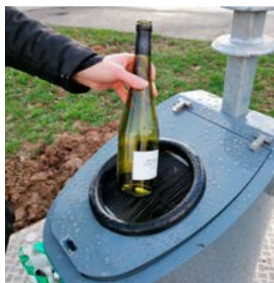
Nouvelle borne verre au terminus de bus Michelet.

La commune de Louvigny ayant été identifiée comme sous dotée en points de collecte du verre, une densification de notre territoire est en cours de réalisation, privilégiant les collecteurs enterrés. Celui du terminus de bus Michelet l'a été courant décembre. Le nouvel équipement qui laisse juste apparaître la bouche de collecte est plus esthétique et moins sonore. Un autre point de collecte sera prochainement implanté place François Mitterrand, en aérien dans un premier temps, puis enterré par la suite. La multiplication des points de collecte vise à augmenter le volume des apports volontaires de bouteilles de verre. On en retrouve encore 9 kgs par an et par habitant dans nos bacs de déchets ménagers !