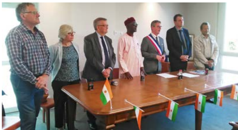
Le 18 juin dernier, à la mairie de Louvigny, les maires des six communes du Calvados et le député-maire de Kornaka signent la nouvelle convention de coopération.