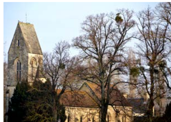
L'église du XIII e au XV e siècle.

qui font le bonheur des pêcheurs mais aussi celui de la loutre, de retour entre Louvigny et Caen.